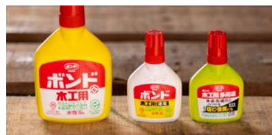
ボンド物流株式会社 会社概要 / 2012年創業。 木工用接着剤「ボンド」でおなじみのコニシ株式会社が製造する商品の保管・物流を担う会社。栃木物流センターと滋賀物流センター、東西に2拠点を構える。

給水などの操作が容易な点、ノンフロンで環境にやさしい点にも満足しています。点数をつけるとしたら、さらなる性能向上という今後の伸びしろに期待して、10点満点中8点!働き方改革の事例として他社に同製品を紹介したことがあります。まだまだ知らない方が多いと思うので、これからも発信していきたいですね。「PureDrive-FL」には、物流の現場をもっと改善してくれる力があると信じています。