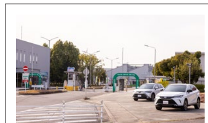
トヨタ自動車株式会社 高岡工場 会社概要 / 愛知県豊田市。1966年9月、生産開始。 3,000人超の従業員が勤務。

もともとトヨタグループ内の情報共有は活発で、これまでさまざまな技術研鑽を重ねてきましたが、ここ数年は同業他社との情報交換の機会も増えています。私の場合は熱中症対策やCO 2 対策についての話題がメインです。日本の自動車業界全体の未来を考え、製造の現場をより快適に、クリーンにできるよう、他社にも「PureDrive-FL」を積極的にお勧めしていきたいと思います。